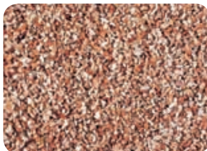
Rosa corallo MK 00 (0,7 - 1,2 mm)