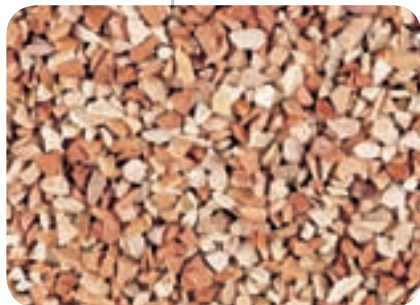
Rosa corallo N. 1 (1 - 3 mm)