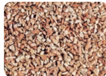
Rosa corallo MK 0 (1,2 - 1,8 mm)