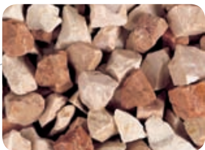
Rosa corallo N. 4 (9 - 12 mm)