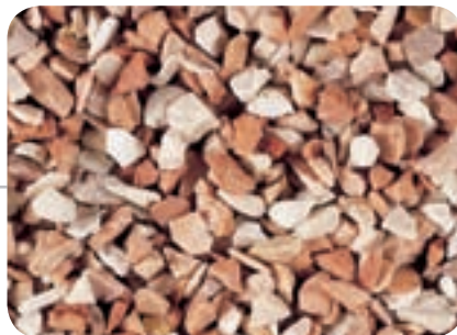
Rosa corallo N. 2 (3 - 6 mm)