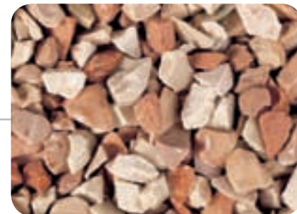
Rosa corallo N. 3 (6 - 9 mm)