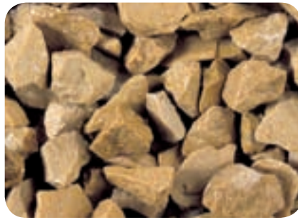
Giallo Oro (Mori)