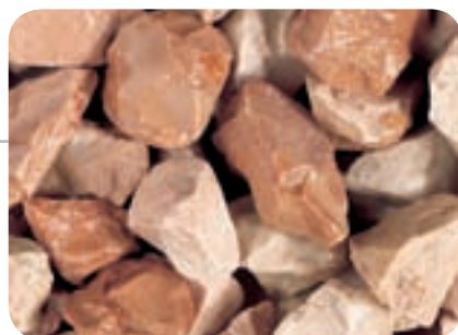
Rosa corallo N. 5 (12 - 16 mm)