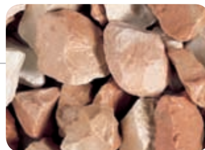
Rosa corallo N. 6 (16 - 21 mm)

Per alcuni materiali sono inoltre disponibili le seguenti misure: