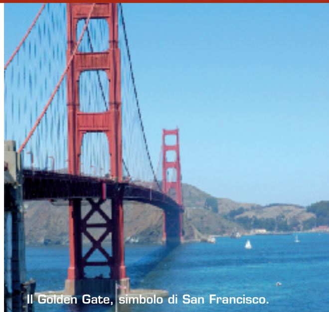
Il Golden Gate, simbolo di San Francisco.

New York la città più entusiasmante al mondo, meta ogni anno di milioni di visitatori con i suoi musei, teatri, negozi delle firme più prestigiose, ristoranti e bar.