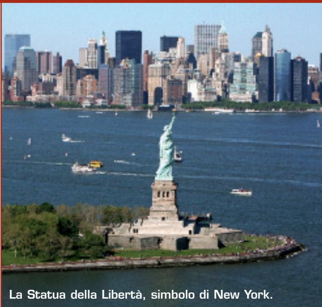
La Statua della Libertà, simbolo di New York.