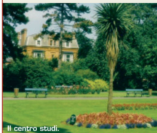
Il centro studi.