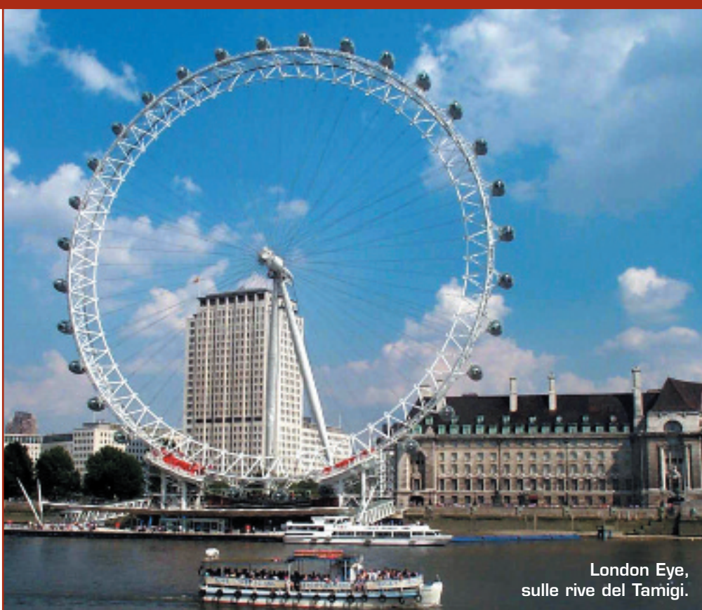
London Eye, sulle rive del Tamigi.

Cuore finanziario, commerciale e turistico europeo, è una città di contrasti: il West End con la sua vibrante vita notturna e la quiete dei grandi parchi cittadini, i centri commerciali più futuristici e i musei che racchiudono l'arte e la storia dell'umanità.