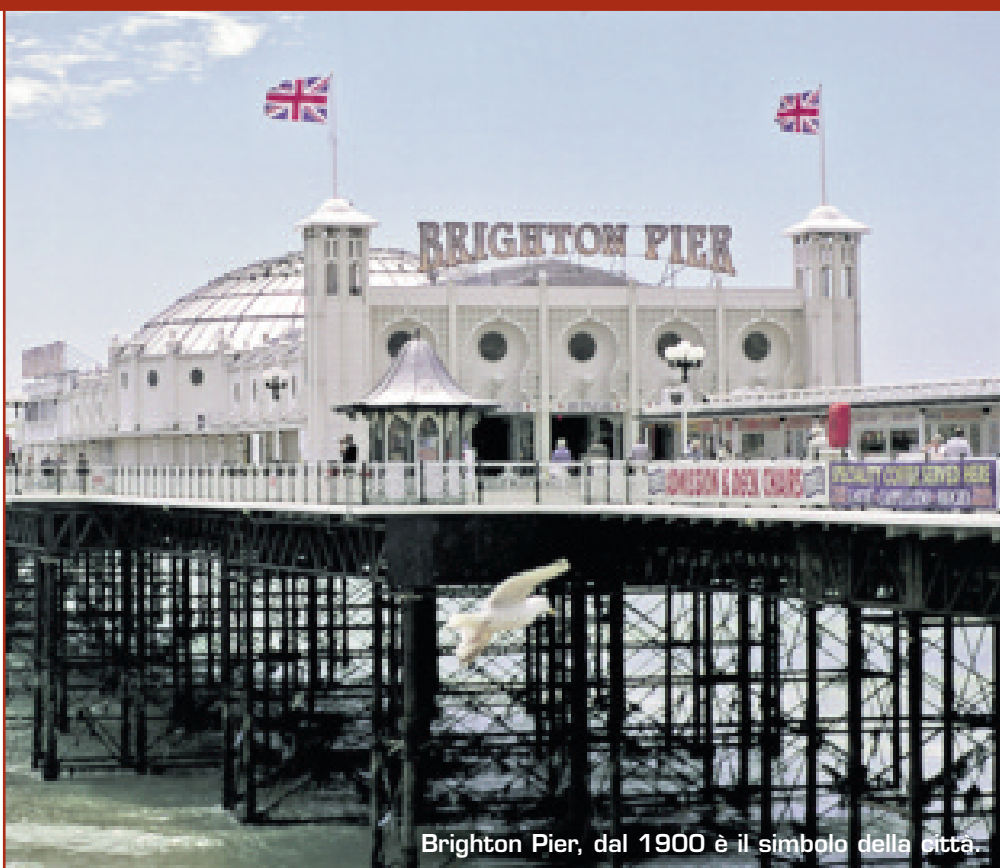
Brighton Pier, dal 1900 è il simbolo della città.

Situata sulla costa meridionale dell'Inghilterra è la città balneare più popolare tra inglesi e turisti. Circondata dal suggestivo "countryside" del Sussex Down è un importante polo universitario. Ben collegata a Londra da un frequente servizio ferroviario: in un'ora si raggiunge Victoria Station nel cuore della metropoli.