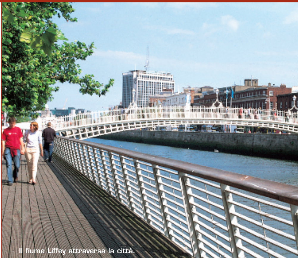
Il fiume Liffey attraversa la città.

Capitale dell'Irlanda, è la città di Joyce ma anche degli U2, è la città della Guinness ma anche del Trinity College. Dublino è una città dalle mille sfaccettature, può essere tranquilla e romantica ma anche scatenata e sfrontata. Con il suo mezzo milione di abitanti è oggi una della capitali europee più visitate non solo dal turismo tradizionale ma anche per affari e studio.