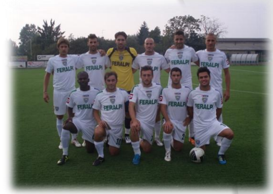
Feralpi Salò Lega PRO 1 Nazionale