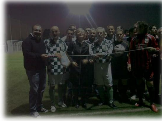
Formazione Amministratori Provincia di Brescia