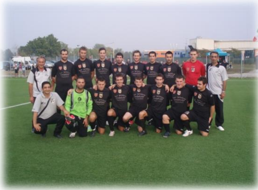
Eagles Bagnolo Campioni in carica Coppa Leonessa