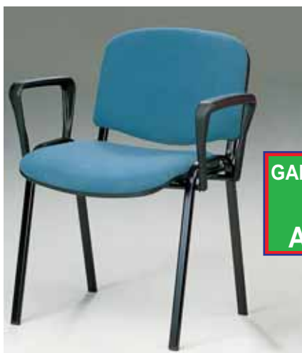
Art. WV153 - braccioli fissi Rivestimento D € 53,00 Rivestimento F-K-S € 61,00