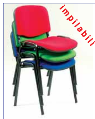
TABELLA TESSUTI A PAG. 63