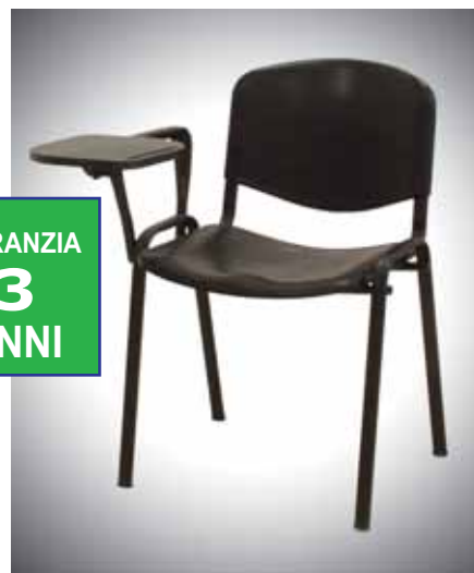
Art. WV123TP1B Tavoletta girevole e ribaltabile in ABS Polipropilene € 49,00