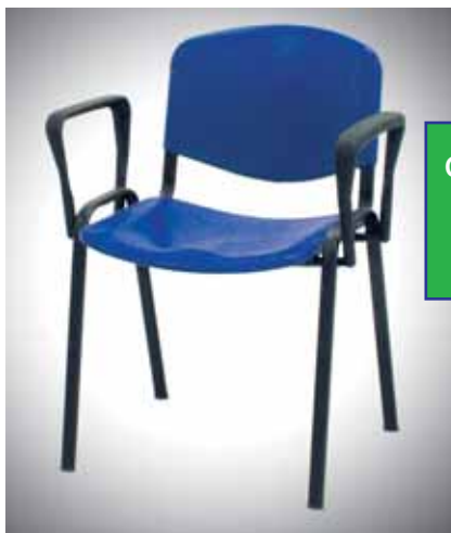
Art. WV123P - braccioli fissi Polipropilene € 43,00

SEDUTA cm. 46x40P SCHIENALE cm. 46x33H ALTEZZA DA TERRA cm. 45 INGOMBRO: cm. 53x57Px80H C/BRACCIOLI cm. 63x57Px80H