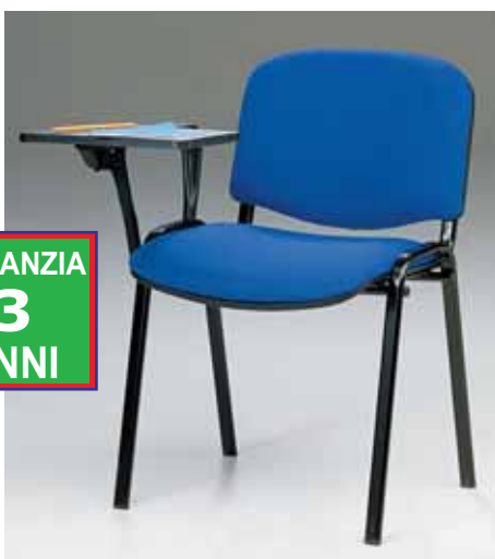
Art. WV153T1B tavoletta girevole e ribaltabile in ABS Rivestimento D € 59,00 Rivestimento F-K-S € 67,00