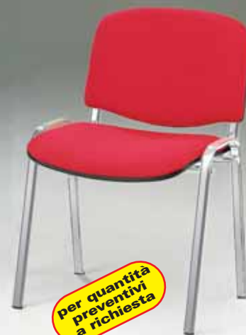
Art. WV154 - impilabile Rivestimento D € 37,00 Rivestimento F-K-S € 45,00