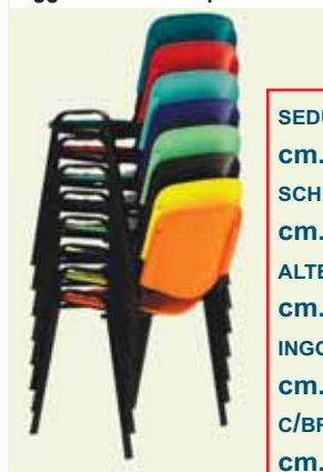
Art. WV154 AGG € 1,00 Aggancio laterale per serie WV

SEDUTA cm. 46x40P SCHIENALE cm. 46x33H ALTEZZA DA TERRA cm. 45 INGOMBRO: cm. 53x57Px80H C/BRACCIOLI cm. 63x57Px80H