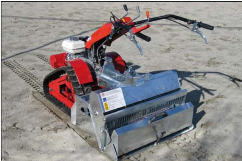
Pratico e maneggevole.