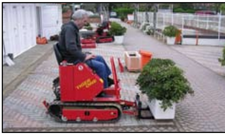
Forche per bancali.