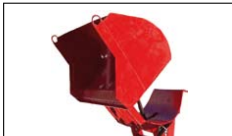
Benna alto scaricamento BT.