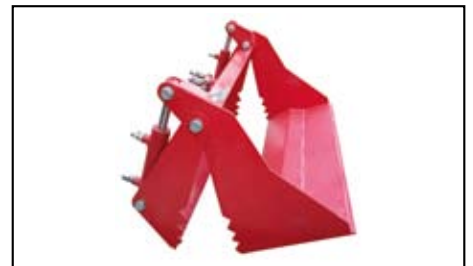
Benna mordente BT.