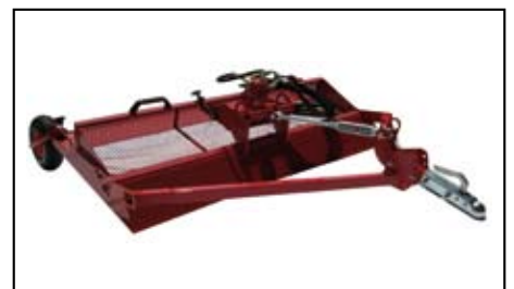
Rastrello vibrante idraulico.