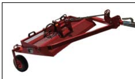
Rastrello vibrante elettrico.