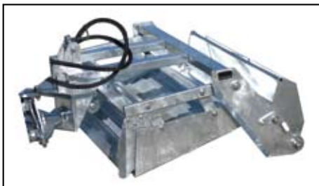
Setaccio mm. 900.