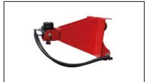
Supporto trivella BT.