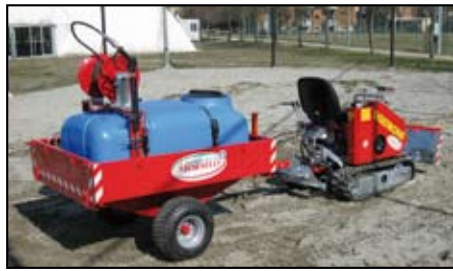
Rimorchietto leggero con cisterna da lt. 300 e pompa ad alta pressione.