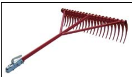
Rastrello per alghe.