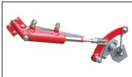
Scarico idraulico setaccio.