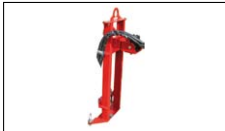
Montante idraulico trivella.