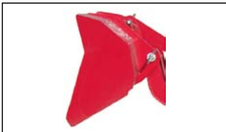
Benna standard BT.