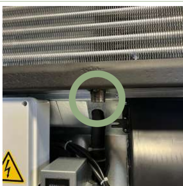
Attacco per lo scarico diretto della condensa