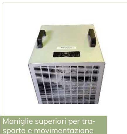
Maniglie superiori per trasporto e movimentazione