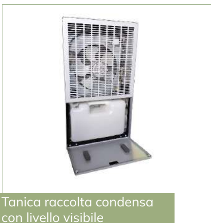
Tanica raccolta condensa con livello visibile