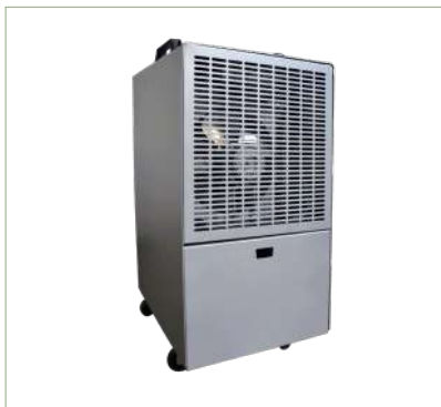
Vano con tanica

Il deumidificatore professionale carellato modello KT-580 ECO è indicato per impegni gravosi, dotato di una robusta struttura in lamiera zincata verniciata, montato su quattro ruote piroettanti che ne facilitano lo spostamento. Deumidificatore d'aria compatto e di estrema affidabilità, dispone di un filtro lavabile, contenitore di raccolta dell'acqua di condensa ed è già predisposto per lo scarico diretto della condensa. Dotato di deumidostato automatico di regolazione a bordo che permette l'arresto automatico del deumidificatore al raggiungimento dell'umidità desiderata. Estremamente generoso nelle prestazioni. Maniglie superiori per agevolare le operazioni di trasporto. Eventualmente disponibile nella versione sbrinamento a g/c a bordo della macchina per poter lavorare in ambienti non riscaldati nel periodo invernale. Caratterizzato da bassi consumi energetici ed equipaggiato con nuovi refrigeranti ecologici R290. Evaporatore ad alta efficienza a tubi lisci.