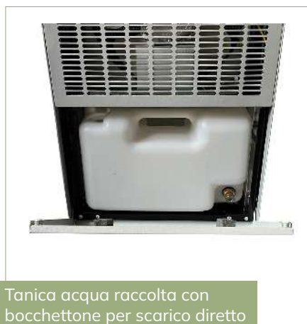
Tanica acqua raccolta con bocchettone per scarico diretto