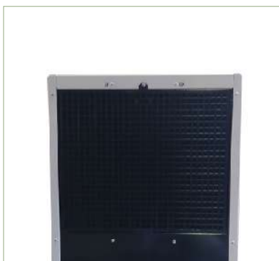
Filtro aspirazione aria

KT-580 ECO (per locali non riscaldati): campo di lavoro +1/+35°C