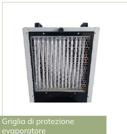
Griglia di protezione evaporatore