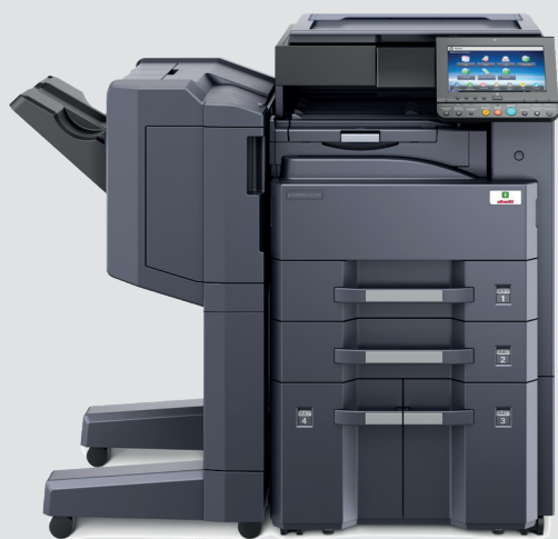
d-Copia 3201MF (o d-Copia 4001MF) + Platen Cover (E) + PF-810 + DF-7120 + AK-740