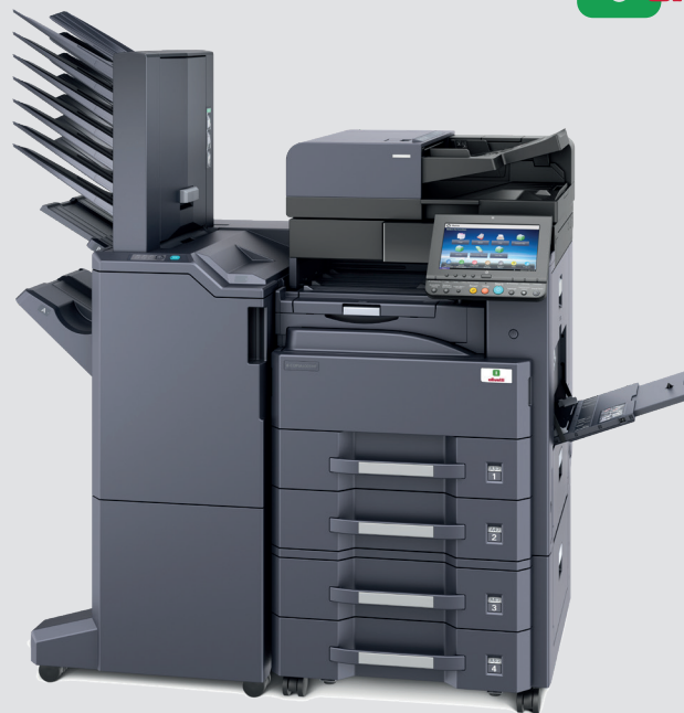
d-Copia 3201MF (o d-Copia 4001MF) + DP-7110 + PF-791 + DF-7110 + AK-740 + MT-730(B)