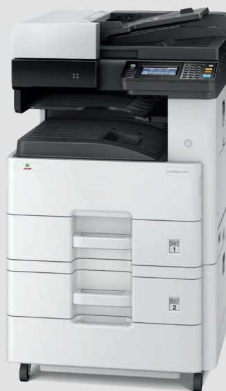
d-Copia 255MF con cassetto opzionale PF-470