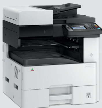
d-Copia 255MF in configurazione base