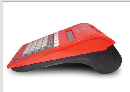
Forma compatta, linee curate e moderne