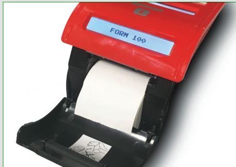
Inserimento rapido e agevole del rotolo carta