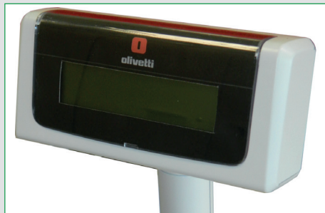
Display cliente grafico remotizzato