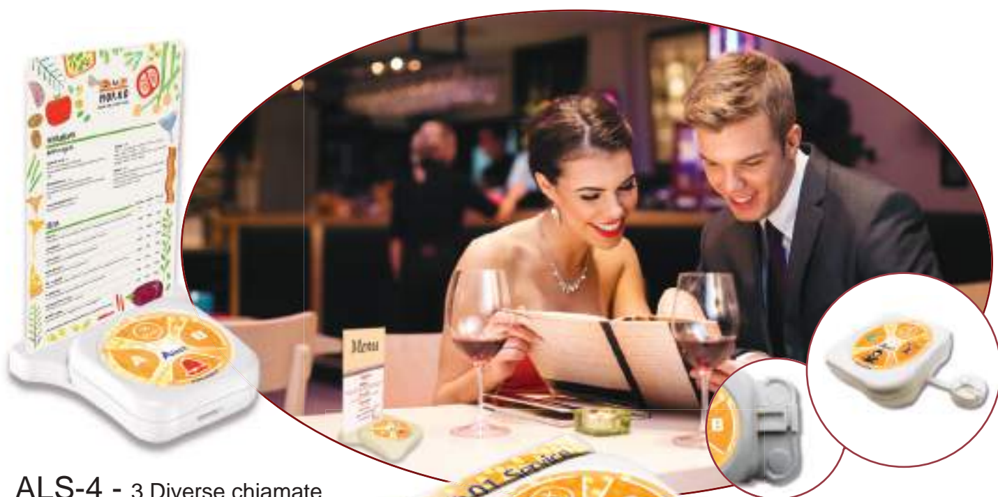
ALS-4 - 3 Diverse chiamate