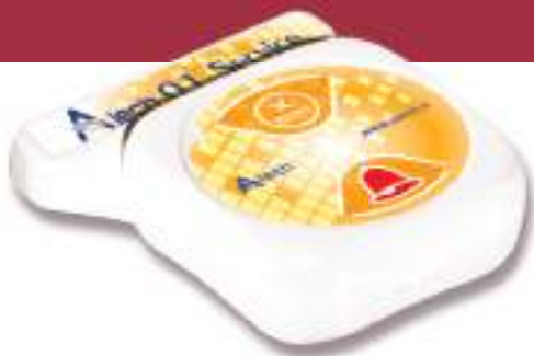
ALS-2 Singola Chiamata