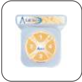
BLS-PRO B Tastiera di chiamata 4 Canali Postazione 2 Vibrazione 2

Tastiera di chiamata a 4 canali Colore: Bianco Avviso batteria scarica Tipo di batteria: CR2477N Durata prevista: 30.000 cicli 5 anni Distanza trasmissione area libera 400 mt Segnalazione acustica e luminosa di chiamata effettuata Dimensioni: 92 x 92 x 32 mm