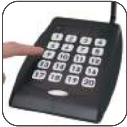
ATX-02B-5 Tastiera di chiamata

Dimensioni: 252 x 210 x 35 mm Frequenza: 420 ~ 470MHz Velocità di trasmissione: 1200 bps Modulazione: FSK Potenza di uscita: 1Watt (copertura 1km) Spaziatura canale: 12.5K Stabilità di frequenza: 2ppm a -10 ~ + 60 Consumo di corrente: Trasmissione: 300mA Alimentazione: adattatore 5V / 2A Certificazione: FCC CE