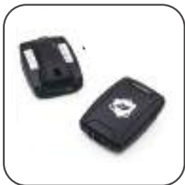
SP-01 PRO Pager

Dimensioni: 120 x 180 x 26,5 mm Frequenza: 433MHz Velocità di trasmissione: 1200 bps Modulazione: FSK Potenza di uscita: 10mW Spaziatura canale: 12.5K Stabilità di frequenza: 2ppm a -10 ~ + 60 Consumo attuale: Trasmissione: alimentazione 300m Appare: adattatore 5V / 2A Certificazione: FCC CE NCC