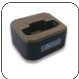
SPC-01S Caricatore Singolo

Dimensioni: 194 x 166 x 36 mm Corrente di carica: 90 ~ 100mA (ogni pager) Alimentazione: adattatore 5V / 2A Corrente di standby: 5mA Certificazione: FCC CE