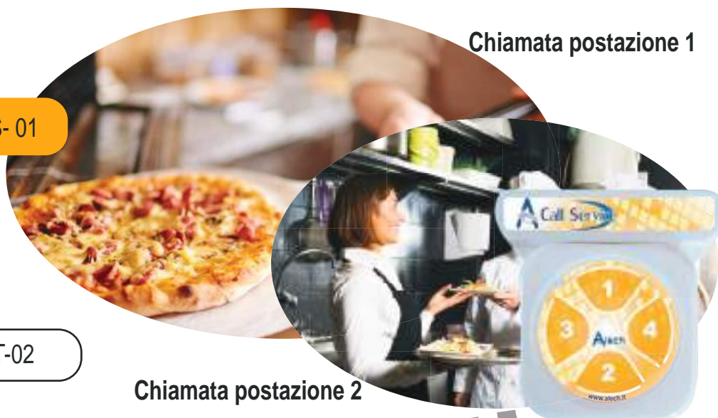
Chiamata postazione 1

Dalla postazione di chiamata si può avvisare il cameriere desiderato in modo discreto tramite suoneria e vibrazione fino a 04 differenti camerieri con la tastiera BLS-01, nel caso di numero maggiore di camerieri si potrà utilizzare la tastiera CT-02.