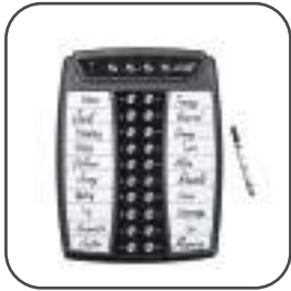
ATX-01 Tastiera di chiamata

Tastiera di chiamata a 4 canali Colore: Bianco Avviso batteria scarica Tipo di batteria: CR2477N Durata prevista: 30.000 cicli 5 anni Distanza trasmissione area libera 400 mt Segnalazione acustica e luminosa di chiamata effettuata Dimensioni: 92 x 92 x 32 mm